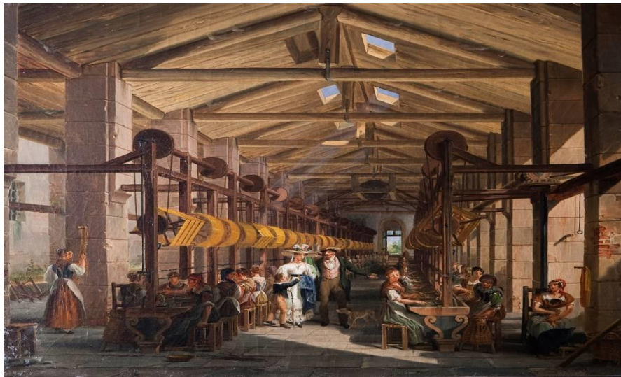
La filanda Mylius a Boffalora (Giovanni Migliara, 1825) - Villa Vigoni

Enrico Mylius (1769-1854) e le relazioni italo-tedesche all'epoca delle rivoluzioni: La Lombardia e le regioni centrosettentrionali dell'Europa nel primo Ottocento